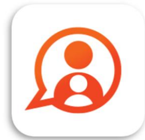
Konnnect OuderApp Konnnect B.V.

Gegevens niet ontvangen? Neem dan contact op met de kinderopvangorganisatie, zij kunnen nieuwe gegevens sturen.